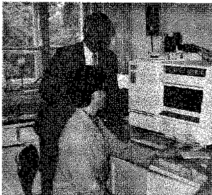
ハルビン師範大学にて（1989年6月）

小冊子には蒸気船などを図解した後に、英単語の発音が片仮名で記してある。最初に天とあり、