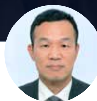
コメンテーター 米原 泰裕 (在インド日本大使館一等書記官)